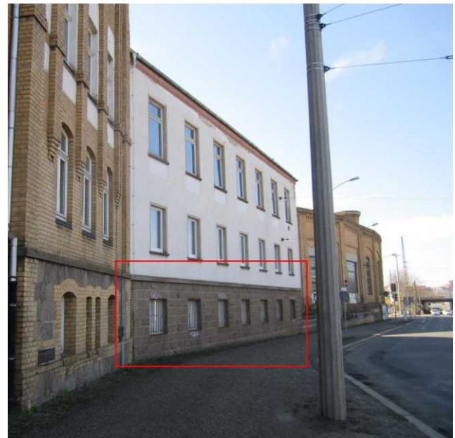
Blick von der Berliner Straße

Interessenten melden sich bei HausHalten e.V. direkt, um weitere Abläufe bzw. einen Besichtigungstermin abzuklären.