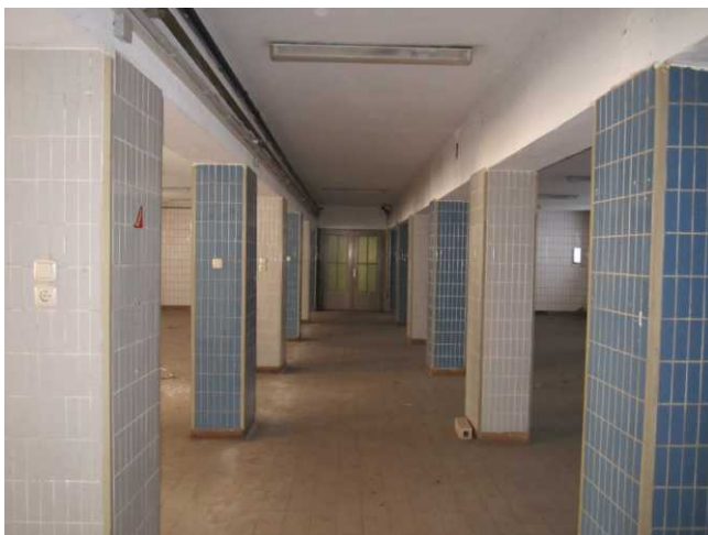
Großer Raum mit 210,00 qm