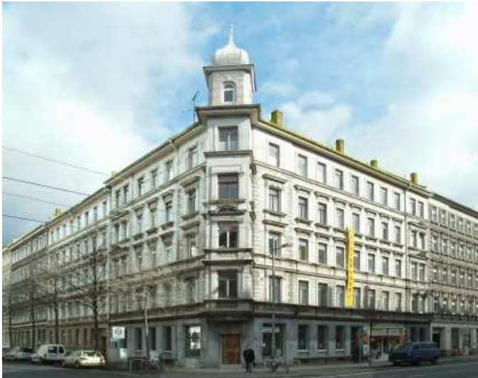
Ein Wächterhaus in Leipzig