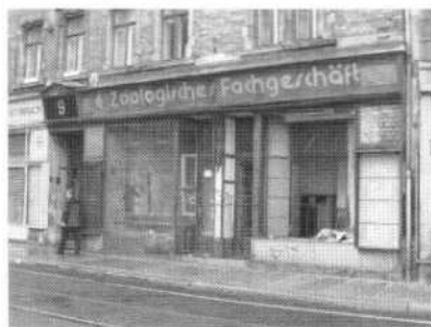
Abb. 1: Leerstehende Gewerbeeinheiten

und Finanzierungskonzept für die Lützner Straße, eine Hauptverkehrsstraße im Leipziger Westen, beauftragt, um aus verschiedenen Ideen, Anregungen und Vorschlägen der Verwaltung und der lokalen Akteure unkonventionelle, innovative und kostengünstige Lösungsansätze herausarbeiten zu lassen (Auftragnehmer: Initiative L21 und Büro StadtLabor, Leipzig). Das Konzept beschreibt erstmals die Idee des »Wächterhauses«, die im Folgenden eine kontinuierliche Weiterentwicklung erfährt und schließlich in der Gründung von HausHalten e. V. mündet.