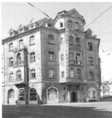
Abb. 3: Wächterhaus Demmeringstraße 21