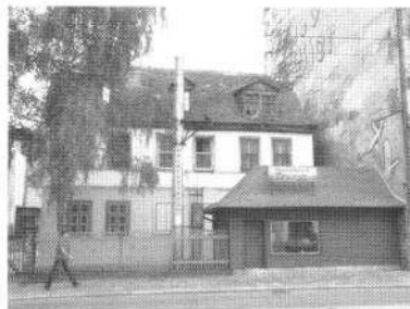
Abb. 5: Bildungs- und Kompetenzzentrum HausHalten Lützner Str. 39

Vor diesem Hintergrund stellt der Aufbau des » Bildungs- und Kompetenzzentrums HausHalten « derzeit eine der wichtigsten Aufgaben des Vereins dar.