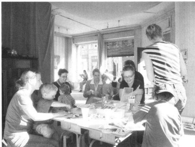
Abb. 4: Hausfest in der Lützner Straße 30