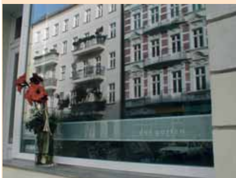
Kleine Läden und Galerien beleben das Straßenbild und das Quartiersleben

Im Jahr 2004 wurden in Berlin-Kreuzberg sieben junge, kreative Projekte und Unternehmen aus Mitteln der Förderprogramme EFRE und Soziale Stadt mit Räumen und Öffentlichkeitsarbeit unterstützt. Sie erhielten in dieser Zeit leerstehende Ladenlokale zu Ihrer Verfügung. Auftraggeber war das örtliche Quartiersmanagementbüro. Die Moderation des Netzwerks übernahm die Kreativ-Agentur Spielfeld. 33 Sie förderte Synergieeffekte durch die Koordination gemeinsamer Aktivitäten und unterstützte den Dialog der Läden untereinander sowie den Kontakt nach außen. Damit geht das Konzept über bloße Immobilienverwertung hinaus. Ziele des Wrangelei-Netzwerks 34 waren eine aktive Stadtgestaltung durch die Erweiterung öffentlicher Räume und die Förderung neuer Ökonomien, Kultur und Lebensformen. 35 Mehrere der Nutzungen haben sich inzwischen stabilisiert und werden auch nach dem Auslaufen der Förderung weiter betrieben.