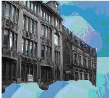
Einfrieren von Bausubstanz