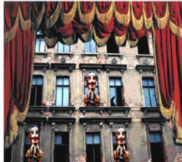
Stadt als Kulisse