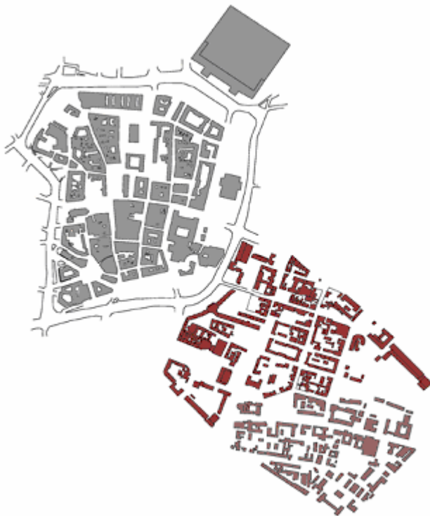
Abb. 2: Das Seeburgviertel

Neue Strategien zur Substanzerhaltung, Eigentums- und Profilbildung werden im Leipziger Seeburgviertel, welches sich direkt an die Innenstadt anschließt (siehe Abb. 2), gebündelt angewendet. Das Gebiet liegt im Ortsteil Zentrum Südost und gehört teilweise zum historisch gewachsenen graphischen Viertel, besitzt aber keine mitgewachsene Identität. Vom Charakter her ein reines Wohngebiet, hat es gerade durch seine Citynähe unentdeckte Potentiale aufzuweisen. Das Seeburgviertel, früher Handwerker-, Handels- und Verlagsviertel ist (noch) ein toter Winkel Leipzigs, ohne eigene Identität und ohne große Bedeutung im gesamtstädtischen Kontext.