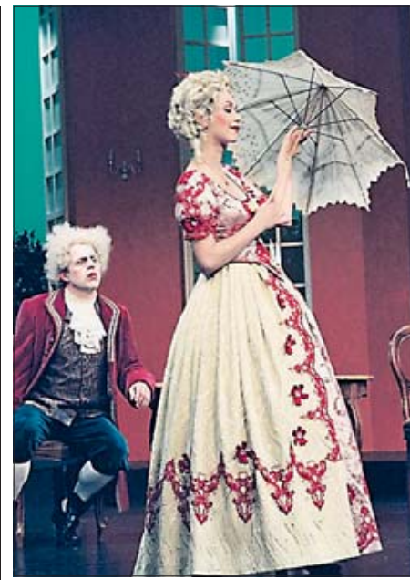
Barockes Textileinerlei, gewitzte Personenregie: Hasses Musikkomödie „Il tuttore“ in Bamberg

Einen bemerkenswerten Beitrag dazu lieferten jetzt die Bamberger Tage Alter Musik, die schon in den vergangenen Jahren barocke Operntrouvailles auf die Bühne des ortsanässigen E.T.A.-Hoffmann-Theaters gebracht haben. Sekundiert von einer Ausstellung der Münchner Hasse-Gesellschaft zu Leben und Werk des Komponisten, ging es diesmal mit „Il tuttore“ von 1730 um eines der pfiffigsten Intermezzi der Operngeschichte.