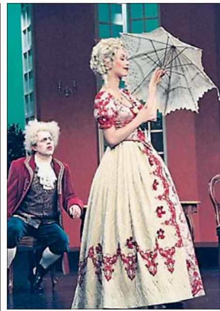
Barockes Textileinerlei, gewitzte Personenregie: Hasses Musikkomödie „Il Tutore“ in Bamberg

Einen bemerkenswerten Beitrag dazu lieferten jetzt die Bamberger Tage Alter Musik, die schon in den vergangenen Jahren barocke Operntrouvaillen auf die Bühne des ortsanässigen E.T.A.-Hoffmann-Theaters gebracht haben. Sekundiert von einer Ausstellung der Münchner Hasse-Gesellschaft zu Leben und Werk des Komponisten, ging es diesmal mit „Il tutore“ von 1730 um eines der pfiffigsten Intermezzi der Operngeschichte.