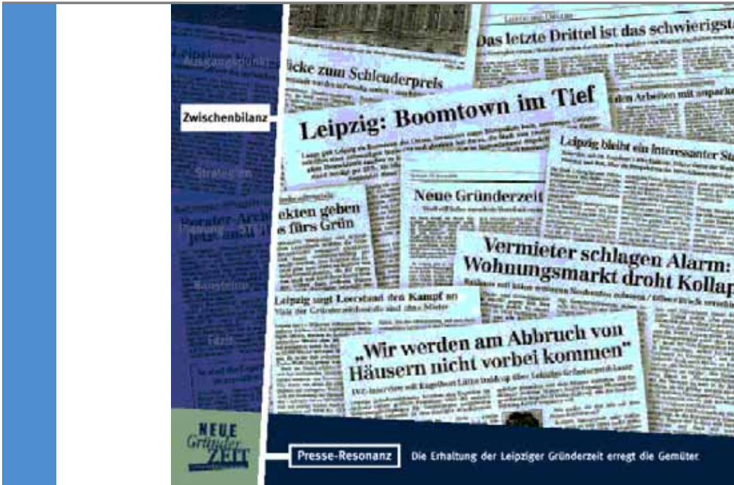
1. Wächterhaustagung 25.09.2009