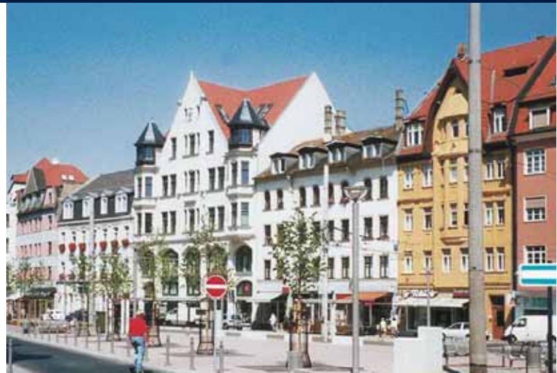
1. Wächterhaustagung 25.09.2009

Amt für Stadterneuerung und Wohnungsbauförderung