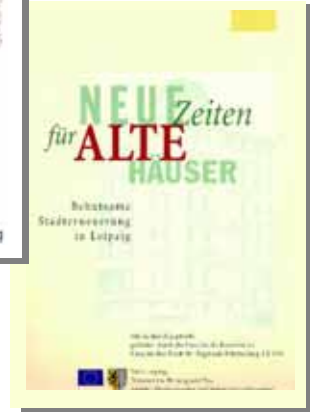
1. Wächterhaustagung 25.09.2009

Amt für Stadterneuerung und Wohnungsbauförderung