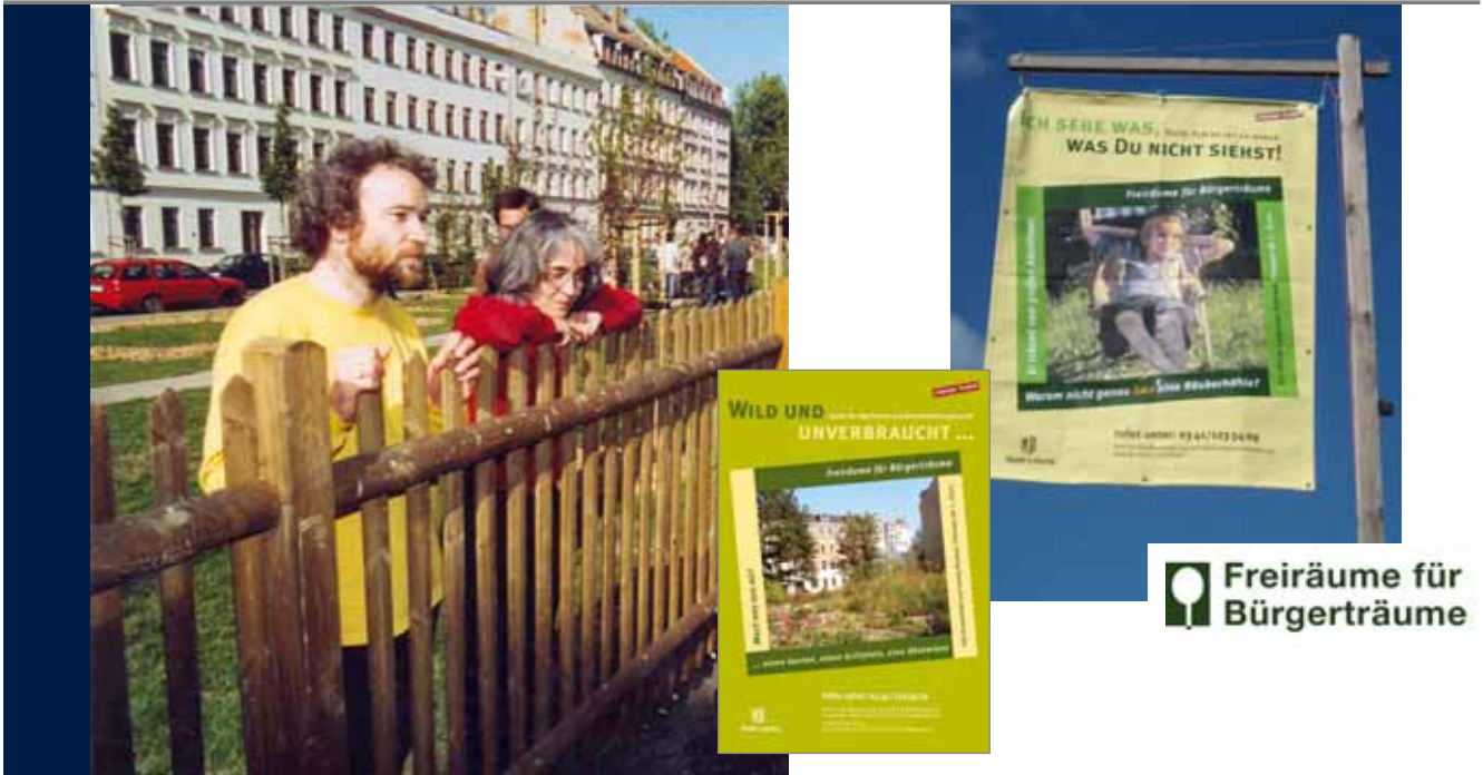
1. Wächterhaustagung 25.09.2009

Amt für Stadterneuerung und Wohnungsbauförderung